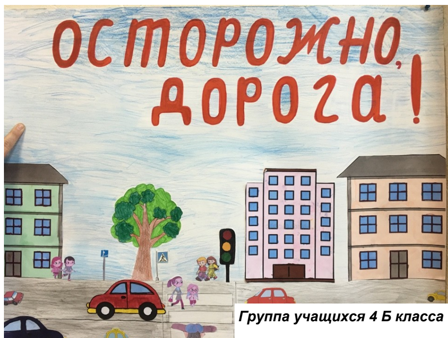
Группа учащихся 4 Б класса