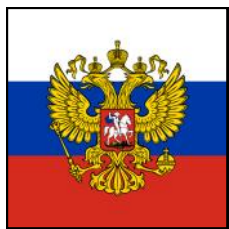
Штандарт Президента РФ