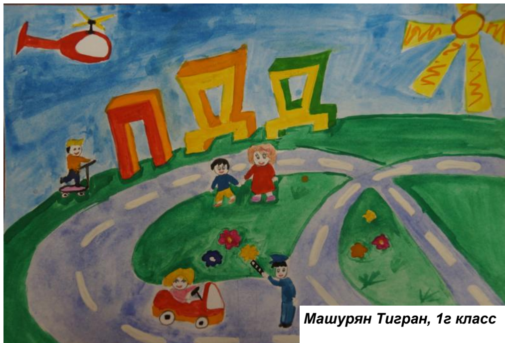
Машурян Тигран, 1г класс

Более подробную информацию обо всех школьных событиях вы можете получить на сайте: http://gimnazia133.ru/