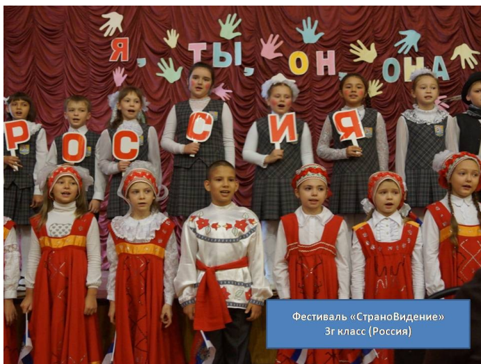
Фестиваль «Страновидение» 3г класс (Россия)