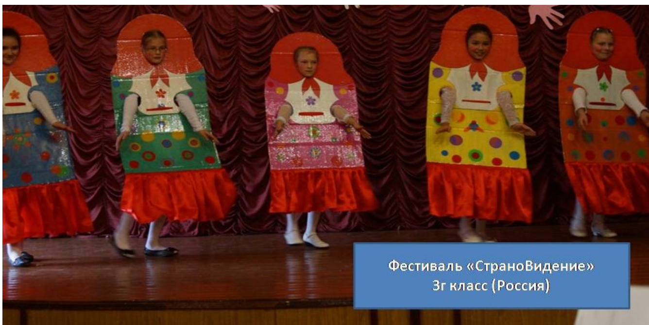
Фестиваль «Страновидение» 3г класс (Россия)