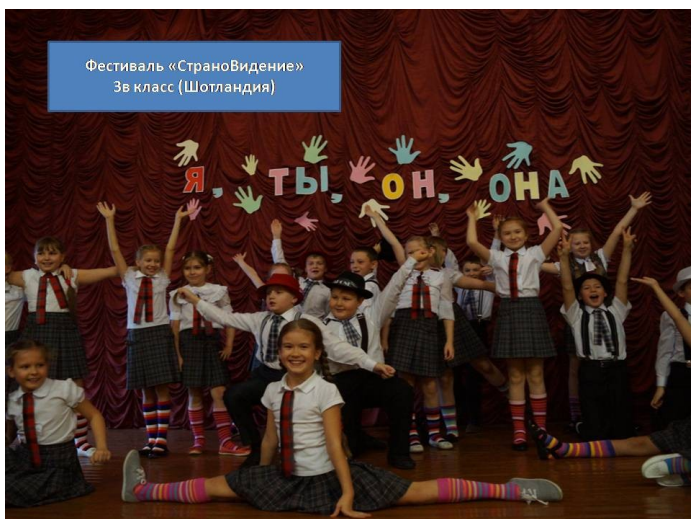
Фестиваль «Страновидение» 3в класс (Шотландия)

Не так давно меня позвали судить одно наше школьное мероприятие под названием «Я, ты, он, она...». Это был конкурс, где соревновались дети четвероклассники. Скажу честно, чего-то особенного и необычного от них я не ждала и собиралась оценивать их со снисхождением. «Они же еще дети» - думала я. Но когда начался сам конкурс, и участники стали выступать, больше я так не думала.