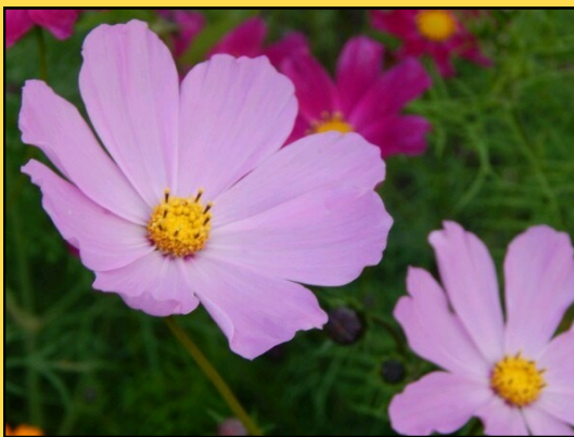
«КРАСОТА ЦВЕТОВ РОССИИ»