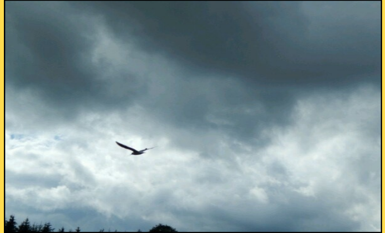
«НЕБО НАД РОДИНОЙ»